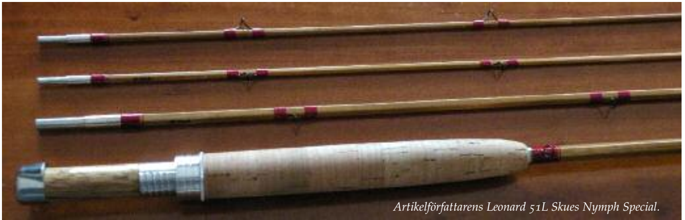
Artikelförfattarens Leonard 51L Skues Nymph Special.